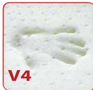
Comp. 4 cm. Viscoelástica